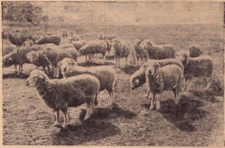
Казахская ССР. В колхозе „Кенес“, Меркенского района, Джамбульской области.

На снимке: овцы породы „Казахская—тонкорунная“ на выпасе.